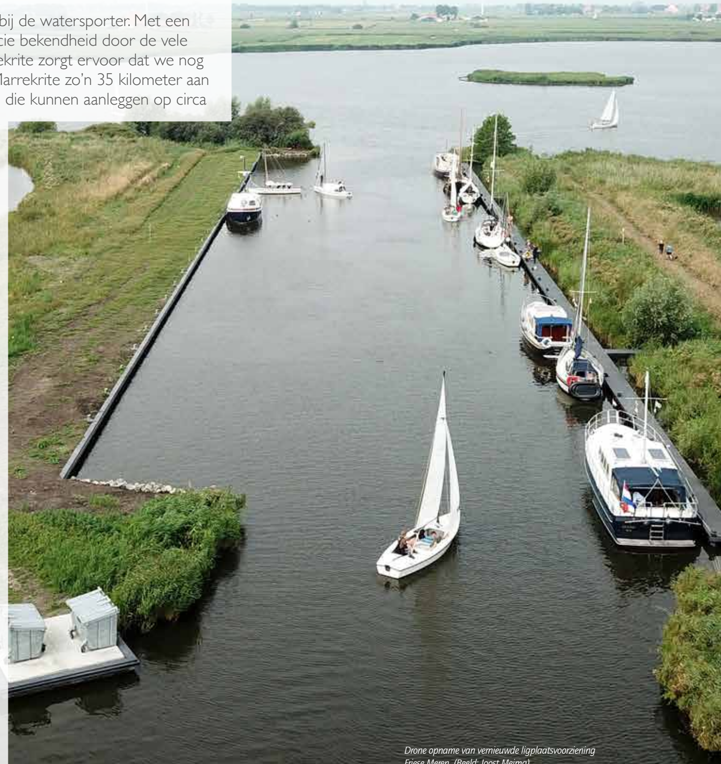
Drone opname van vernieuwde ligplaatsvoorziening Friese Meren.

Er zijn meer voordelen te benoemen van het inzetten van betonnen damwandplanken. De prijs is lager dan van hardhout, de lengte en breedte zijn minder beperkt dan die van de hardhouten delen (in het geval van Marrekrite spreken we over damwandplanken van tussen de 4 en 6 meter lengte) en er is minder tot geen onderhoud nodig. Wie interesse heeft in het aanbrengen van betonnen damwandplanken of een specialistische oplossing in beton zoekt, zoals bijvoorbeeld de poeren voor de Marrekrite Pompeblèden bolders, is van harte welkom om contact op te nemen met Betonfabriek Nigtevecht. ■