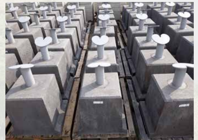
Antracietkleurige bolders met ingestorte Marrekrite pompeblèden.